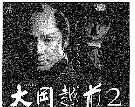
大岡越前2 出典: http://www.nhk.or.jp/jidaigeki/ooka2/index.html

皆さんは「NHKが時代劇を三つ持っていること」を知っているだろうか。毎週日曜午後八時から「大岡越前2」について扱う。 まず、ドラマについてであるが、これは一九七〇年にTBSで放送されていた加藤剛主演の「大岡越前」のリメイクとして二〇一三年に放送された「大岡越前」の続編である。セットや主題歌などが加藤版と同じものであるため、今回の「大岡越前」はつまらないという意見もあるが、高校生の立場からすると一九七〇年にはこの世にいないため加藤のは見れないので今回のを見るべきだと思ふ(正確には時代劇専門チャンネルで加藤版「大岡越前」の再放送をやっているが、CSを契約している人も少ないかもしれないし、契約していてもわざわざ見るモノ好きは記者くらいしかいないだろう)。 次に今回の「大岡越前」の主なキャストである。主演は東山紀之で妻の雪絵は国仲涼子、父は津川雅彦、将軍徳川吉宗は平岳大である。 最後に、よく「大岡越前」で話題になる史実とドラマの相違点としては忠相の父忠高は、忠相が江戸町奉行に就任した時には他界している点や、忠相が江戸町奉行に就任した時にはすでに子がいるため当然妻もいる